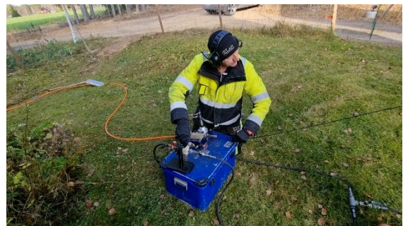
Fiberblåsning i Rödåsel för att ansluta en av de 19 fastigheter som tillkom år 2024.

Utöver allmän information och till exempel kallelser till möten kan man också läsa om när det uppstått ett avbrott eller andra driftstörningar. Fungerar inte bredbandet kan man ju alltid koppla upp sig via mobilen om man har en sådan. När man är på Tavelsjö ByaNäts facebookside är det klokt att markera "Följ" + "Gilla". Då kommer det uppdateringar direkt i det egna flödet.